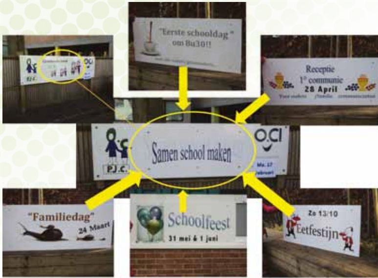
Paneel aan de schoolpoort met wisselende borden over de activiteiten van de ouderwerking.